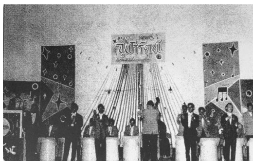
ภาพที่ 3 : วงจุฬารัตน์