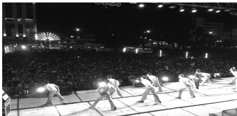
ภาพที่ 5 : กลุ่มแฟนคลับหมอลำเรื่องต่อกลอน

กล่าวคือ วัฒนธรรมเป็นสิ่งที่ทำหน้าที่เป็นตัวสื่อกลาง (Mediator) ในการพัฒนา “การดำรงอยู่” (Social Being) ของคนคนหนึ่งให้กลายเป็นมนุษย์ที่มี “จิตสำนึกทางสังคม” (Social Consciousness) ด้วยเหตุนี้ลักษณะวัฒนธรรมของแต่ละสังคมจึงขึ้นอยู่กับบริบทของสภาพความเป็นจริงของสังคมนั้น ดังนั้นหมอลำเรื่องต่อกลอนจึงเป็นสื่อหรือตัวกลางทำให้คนภาคอีสานรู้จักอนุรักษ์สืบพันธุ์บ้านให้ดำรงอยู่ต่อไป เพราะเป็นอัตลักษณ์เด่นประเภทหนึ่งของภาคอีสาน