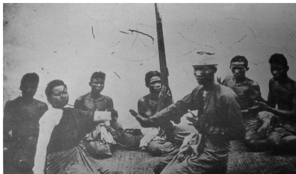
ภาพที่ 2 : หมอลำแสดงพิธีกรรม (หมอลำผีฟ้า)

2. หมอลำที่แสดงในพิธีกรรม ได้แก่ หมอลำผีฟ้า เป็นการลำที่มีจุดประสงค์ 2 ประการ คือ รักษาคนป่วยหรือพยากรณ์ดินฟ้าอากาศ ทำนองจะเป็นจังหวะสั้นบ้าง ยาวบ้าง ใช้แคนเป็นเครื่องดนตรีประกอบ เนื้อหากลอนลำจะเป็นการกล่าวถึงสิ่งศักดิ์สิทธิ์ที่หมอลำอัญเชิญมา โดยหมอลำมีคนเดียวและอาจมีบริวารเป็นผู้ฟ้อนรำประกอบลีลาการฟ้อน ไม่มีแบบแผนแน่นอน