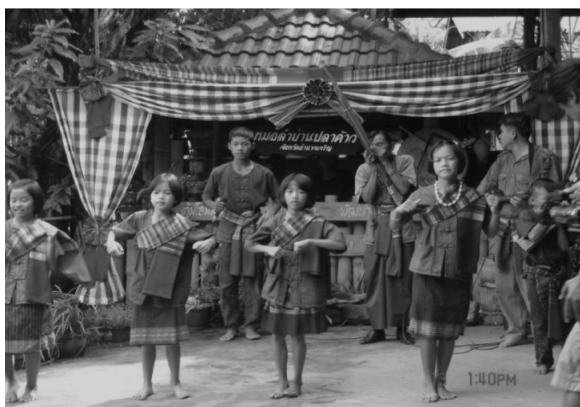
ภาพที่ 5 : กลุ่มเยาวชนบ้านปลาข้าว

Saynago, S. (2013) กล่าวว่า การเรียนรู้เป็นกระบวนการของการเปลี่ยนแปลงพฤติกรรมอันเนื่องมาจากประสบการณ์ที่แต่ละบุคคลได้รับมา ผลของการเรียนรู้จะช่วยให้เกิดการเปลี่ยนแปลงพฤติกรรมในด้านความรู้ทักษะและความรู้สึกกระบวนการเรียนรู้เป็นไปตามขั้นตอน ซึ่งจากกระบวนการเรียนรู้ทั้งหมดที่กล่าวมาข้างต้นประการหนึ่งเป็นข้อสำคัญมากในการเรียนรู้คือแรงจูงใจ หากการเรียนรู้ด้วยการบังคับผลลัพธ์คือความรู้ย่อมไม่เต็มที่หรืออาจจะได้ผลตามเกณฑ์ที่คาดหวัง แต่ความรู้นั้นไม่คงทนถาวร หลังจากการเรียนรู้สักพัก ความรู้นั้นก็จะเลือนหายไปไม่สามารถอธิบายได้ แรงจูงใจเป็นสิ่งที่สร้างขึ้นในมโนสำนึกที่ลักษณะไม่คงที่ และไม่สามารถประเมินได้โดยตรง เป็นจำนวนพลังงาน เป็นความพยายามที่บุคคลจะใช้เพื่อให้บรรลุเป้าหมายใดเป้าหมายนั้น ย่อมให้การเรียนรู้ประสบผลความสำเร็จ ซึ่งอาจเกิดขึ้นเพราะมีปัญหาความคาดหวังของแต่ละบุคคล ที่จะทำให้เกิดเป้าหมายหรือการเรียนรู้และการนำไปใช้ ดังนั้น เพื่อไม่ให้หมอลำหายไปจากภาคอีสาน จึงมีการส่งเสริมให้กับเยาวชนได้ฝึกฝนเรียนรู้ถึงวัฒนธรรมของตนเองโดยมีการจัดการเรียนการสอนวิชาหมอลำ เช่น หมอลำปลาข้าว จังหวัดอำนาจเจริญ เป็นต้น