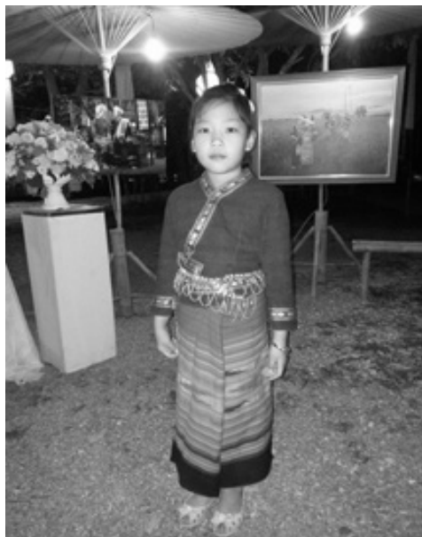
ความน่ารักของเด็กสาวใส่ชุดชาติพันธุ์ไทลื้อ

ปัจจัยด้านนโยบายของกระทรวงศึกษาธิการ ที่ส่งเสริมให้เด็กนักเรียนแต่งกายด้วยชุดประจำชาติพันธุ์ประจำท้องถิ่น เป็นอีกปัจจัยหนึ่งที่มีส่วนทำให้มีการดำรงอยู่ของการทอผ้าถึงแม้ว่าจะไม่มากนัก แต่ก็ยังส่งผลต่อการนิยมแต่งกายด้วยชุดประจำชาติพันธุ์แต่ละพื้นที่รวมทั้งชาวไทลื้อด้วย